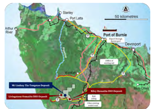
マウントリンゼイ、リビングストーン & ライリーの場所

リビングストーン DSO プロジェクトはベンチャー ミネラルズ社が所有するマウントリンゼイ鉱床より 3.5km の場所に位置しており、ヘマタイトの露出がマグネタイトが豊富なスカルンを覆っています。マウントリンゼイ鉱床より 10km の場所にあるライリー-DSO プロジェクトは地表にて行われ、既存する鉄道や港施設へのアクセスが整っている塗装道路から 2km 以内の場所にあります。