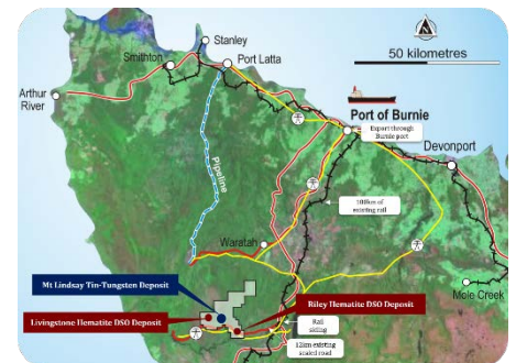
マウントリンゼイ、リビングストーン & ライリーの場所

最近行われている探査作業では、プロジェクトの経済性を大きく向上するべく、既存する鉱床からのトラック輸送距離内での更なる高品質の錫/タングステンの特定に焦点を当てています。