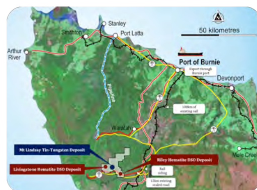
Mt Lindsay、Livingstone 与 Riley 项目位置图

Livingstone DSO 项目距离 Venture 公司的 Mt Lindsay 矿床仅 3.5 公里，包含露出地表的赤铁矿冠岩，覆盖于富含磁铁矿的硅卡岩上。Riley DSO 项目距离 Mt Lindsay 项目 10 公里，矿山座落于地表，不到两公里处就有一条柏油路，通往现有铁路与港口设施。