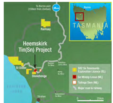
ホームスケルク錫プロジェクトの場所