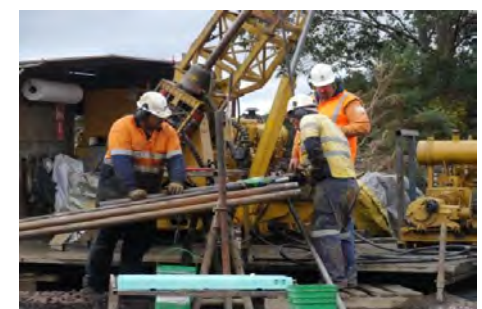
ホームスケルクにおける掘削リグ