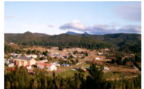
ジーハンの街 & クイーン ヒル ホームスケルクプロジェクト

E メール: peter.blight@stellaresources.com.au