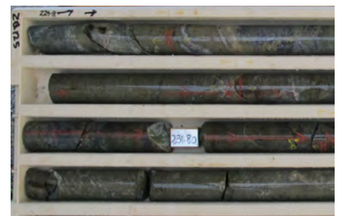
ホームスケルク コア: 高等級錫区域の一部 (錫平均7m @ 1.67%、1m @ 5.55%を含ま)

2017年5月、ステラ社は9,000mに及ぶダイヤモンド採掘プログラムを開始し、最終的な実現可能性についての研究のサポートとなる資源推測表示のアップグレードを目指しています。同社では、2018年中旬にこの研究を完了させる予定です。その後12ヵ月間における融資や工事により、2019年中旬までには錫生産が開始されると検討されています。