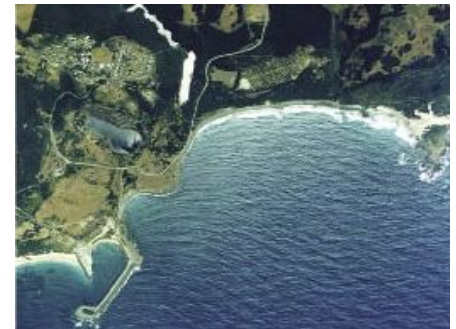
現在の修復サイト