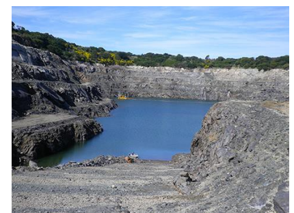
ドルフィン露天鉱山にて脱水が行われている様子