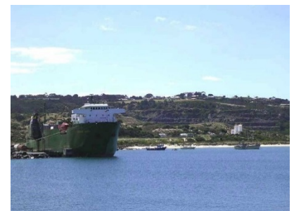
グラッシーハーバー

最終的実現可能性の研究では、市場基盤によって支えられる堅固な開発計画により、多大な経済的利益が生み出されることが立証されています。露天採掘から探査の範囲を大きく拡大することで、現在 16 年以上と予測される鉱山寿命を持つ坑内作業を大幅に延ばすことになります。現在の保有地内にて、タングステン鉱化の特定についても詳細が調べられています。