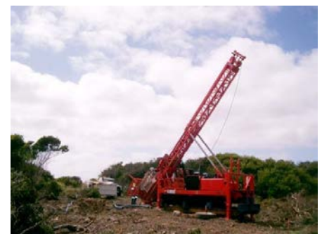
掘削リグによる地盤作業