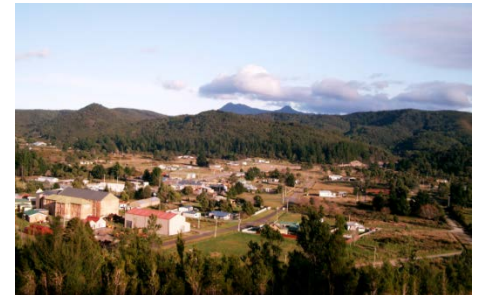
ジーハンの街 & クイーンヒル ホームスケルクプロジェクト

Eメール: peter.blight@stellaresources.com.au