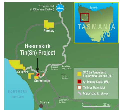
ホームスケルク錫プロジェクトの場所