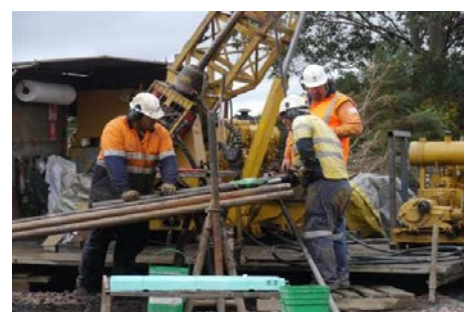
ホームスケルクにおける掘削リグ